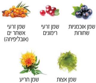
שמן זרעי אשחר ים (אובליפיה)